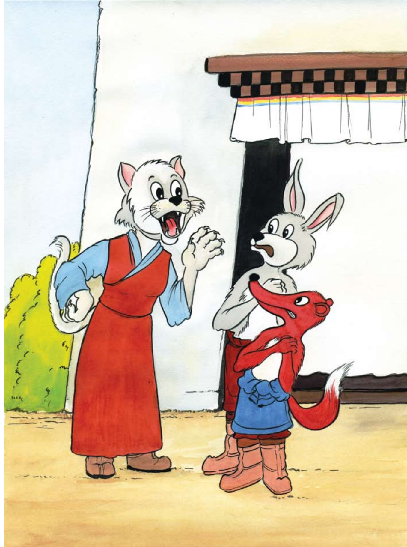
ནང་དོན་དུ། མི་གཞན་ལ་རྒྱས་མངའ་མེད་པར་ཡིད་ཆེས་བྱེད་མི་ཉན་ཟེར།

༄༅། བེངས་ཤིག་དེ་ཚོ་དེ་ལྟུག་ཙམ་རིང་གི་ལ་དགོང་ཟས་ཟ་བར་གྱིན། ཁོས་གོང་ཚོའི་ཚལ་ཞིང་ བར་གི་ལོ་ལའོར་པད་ཚལ་རྒྱགས་ཚད་བཟས་ནས་ཚང་ལ་ལོག། ཁོ་གི་ལ་ལོ་དུས་ཚང་གི་སྐོ་རྒྱག་རྒྱ་ ལུས་པས་དེའི་རིང་ལ་ནེ་ལེ་ཞིག་གིས་ག་ལེར་གྱིན་ནས་དེ་ཚོ་གི་ཚང་ནང་དུ་བསྐྱད། འོན་ཀྱང་དེ་ ཚོ་ཚང་ལ་ལོག་ཡོང་དུས་ནེ་ལེ་ཞི་སྐོ་རྒྱག་དེ་རང་ཉིད་ཀྱི་ཚང་ནང་ནས་གྱི་ལ་བརྒྱངས་ནས་བསྐྱད་ ཡོད་པ་མཐོང་། དེ་ཚོ་དེ་ཁོང་སྐོ་ཟ་ཐག་ཚོད་ནས་ནེ་ལེ་ཞི་ལ་ལམ་སང་དེ་ནས་འགྲོ་རོགས་ཞེས་བཤད་ འོན་ཀྱང་ནེ་ལེ་ཞིས་ཚང་དེའི་ནང་ལ་ང་བསྐྱད་ཚར་ཅང་ད་ནི་ང་ལ་བདག་པ་རེད། ད་རང་གི་ལ་ མཚན་སྐང་བསྐྱད་ནའང་འདྲ་ག་རེ་བྱས་ཀྱང་གང་ལྟར་ང་ནི་ཚང་དེ་ནས་མི་འགྲོ་ཐག་ཚོད་ཡིན། ཞེས་ བཤད། ཁོང་གཉིས་ཚོ་ད་པ་རྒྱག་བཞིན་པ་དེ་ཞི་མི་ཞིག་གིས་ཐོས་ནས་ཁོང་གཉིས་ལ་བཤད་དོན་ཁྱེད་ གཉིས་ཚུར་ཤོག་དང་ ང་དང་ཐག་ཉེ་ཙམ་ཤོག་དང་། ངས་ཁྱེད་གཉིས་ལ་བསྐྱབ་བྱ་ཡག་པོ་ཞིག་བརྒྱག་ རྒྱ་ཡིན། ང་ནི་རྒྱ་དུས་ནས་ན་བ་འོན་སྐོག་སྐོག་ཅིག་ཡིན་པས་ག་རེ་བཤད་མེད་གསལ་པོ་ཐོས་ཀྱི་མི་ འདུག ཞེས་བཤད། ཁོང་གཉིས་ཀས་ཞི་མིས་བྲང་པོ་བྱེད་ཀྱི་རེད་སྟེ་ནས་ཚུར་ཡོང་དུས་སྐོ་བྱར་དུ་ཞི་ མིས་ཁོང་གཉིས་ཀ་ཉོབ་ནས་སྟེ་བཟུང་ནས་དེའི་དགོང་ཚོའི་ཞལ་ལག་བྱས། ཞི་མིས་ཁོང་གཉིས་ཀའི་ ཚོད་གཞི་དེ་མེད་པ་བཟོས་པ་རེད།།